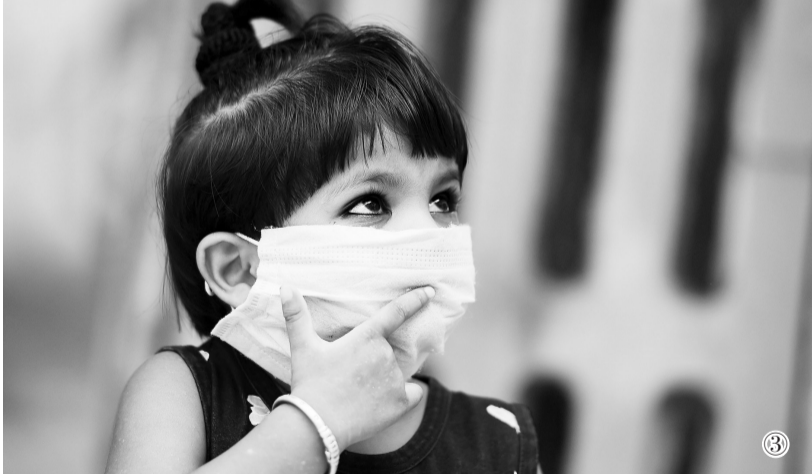
图①:7月30日,一名男子在尼泊尔加德满都的移动新冠病毒检测车上接受新冠病毒检测采样。 图②:8月7日,一名市民戴着口罩在巴西首都巴西利亚出行。 图③:8月7日,在印度安拉阿巴德,一名儿童等候接受新冠病毒检测。

世界卫生组织9日公布的最新数据显示,全球累计新冠确诊病例达19462112例。世卫组织每日疫情报告显示,截至欧洲中部时间9日10时(北京时间16时),全球确诊病例较前一日增加273552例,达到19462112例;死亡病例增加6207例,达到722285例。美国约翰斯·霍普金斯大学9日发布的新冠疫情最新统计数据显示,美国累计确诊病例已超过500万例。美国累计确诊病例从400万例飙升至500万例仅耗时17天。美国流行病学专家认为,美国当前处于应对新冠疫情的“新阶段”,疫情正在“极其广泛地蔓延”。