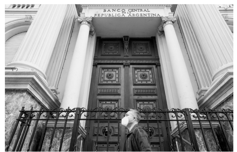
这是8月4日在阿根廷首都布宜诺斯艾利斯拍摄的阿根廷中央银行大楼。在经历数月谈判后，阿根廷政府4日发布公报，宣布与国际债权人达成近700亿美元债务重组协议。