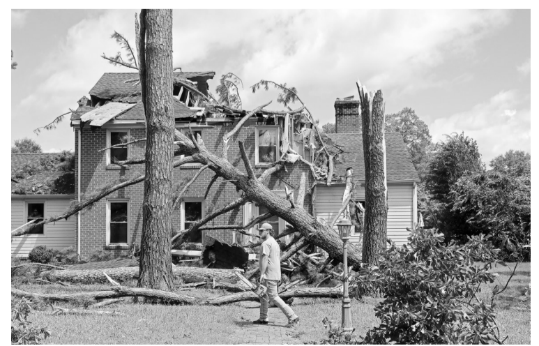
8月4日，一名男子在美国萨福克走过飓风过后受损的树木和房屋。美国国家飓风研究中心3日说，“伊萨亚斯”当晚增强为1级飓风，随后在美国东北部北卡罗来纳州登陆。飓风给美国东部部分地区带来强风和暴雨。