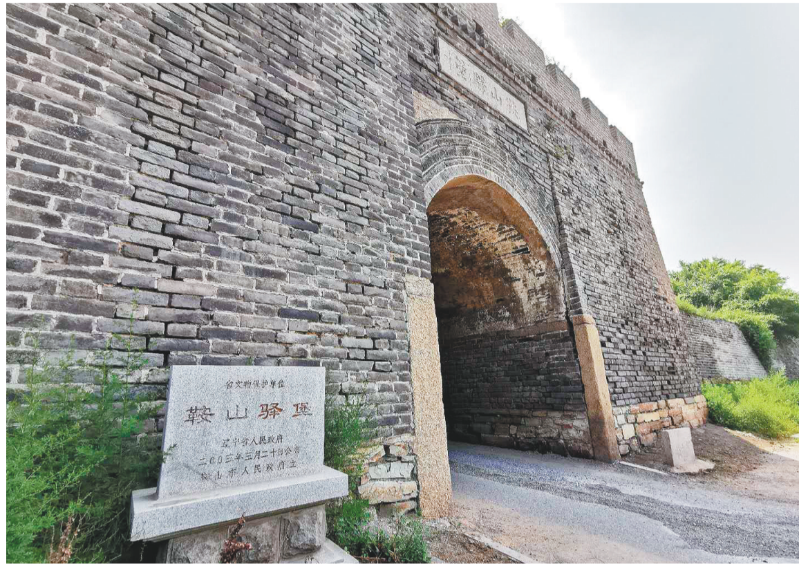
鞍山驿堡西南城门。

鞍山市因为鞍山驿堡而得名,那么,鞍山驿堡的名字又是怎么来的呢?学术界较为一致的观点是“因山得名”,也就是说,因为鞍山驿堡附近的这两座山峰酷似马鞍,所以被命名为“鞍山驿堡”。