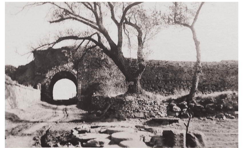
二十世纪初期的鞍山驿堡城门。(资料图)

驿堡衰败,由此可见。 (本文图片除署名外,由本报记者朱忠鹤拍摄。采访资料支持:《盛京通志》《燕行录全集》《清太祖高皇帝实录》)