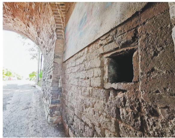
城拱门内的门洞洞。