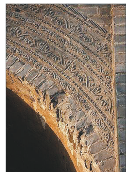
城门上的装饰花纹。