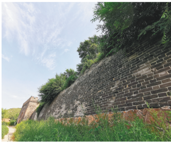
鞍山驿堡古城墙现状。