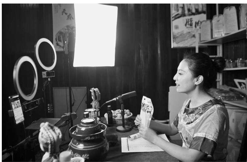
重庆奉节县龙桥乡龙桥村工作人员通过直播平台推介当地土特产。

年第三季度我国居民出游意愿为80.22%,同比恢复九成左右,随着旅游业复工复产的持续推进,人们出游意愿和旅游消费将进一步提升。