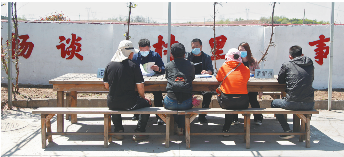
评理说事点建在群众愿意去、方便去的地方。

实践证明,带着泥土芬芳的“村民评理说事点”,已经成为群众说事、议事、调事的新平台和“聚会厅”,受到了人民群众和广大基层干部的赞许和欢迎,取得了良好的社会效果。