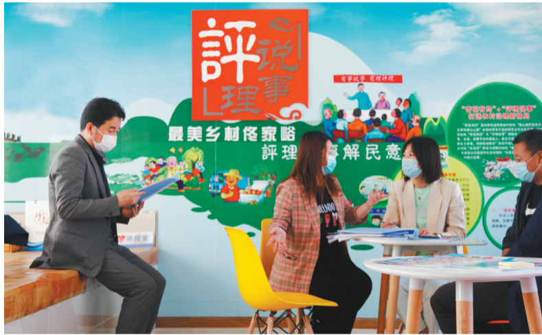
沈阳市浑南区佟家峪社区评理说事员在进行调解。

“作为基层社会治理的有效实践和探索,‘村民评理说事点’还是社情民意汇聚点,收集小到家家长里短、邻里矛盾,大到房屋拆迁、土地纠纷等与百姓生产生活息息相关的各类问题,为政府服务改善民生和推进基层社会治理提供依据和参考;同时也是公共法律服务点、干群关系联系点、文明风尚传播点。”省司法厅副厅长郝集体解释,“在这里,可以解答法律咨询、代办法律援助,宣传普及与群众生产生活密切相关的法律法规;宣扬社会主义核心价值观,引导群众树立社会主义核心价值观,自觉抵制不良社会风气。”