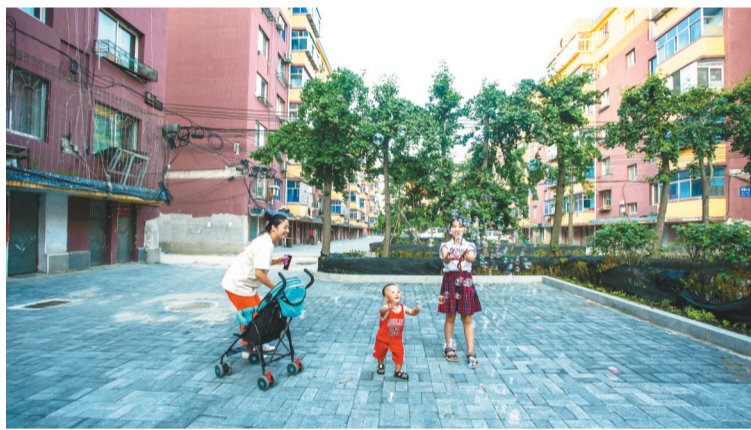
居民在改造后的碧海小区内休闲娱乐。

为强化对小区党支部的待遇保障,丹东市委制定出台城市小区党支部建设“1+N”管理办法,在关怀帮扶、场所建设、经费保障等方面分别列出务实管用的硬措施。每年为805个城市小区党支部拨付483万元专项经费;通过改造闲置自行车棚等方式加强小区党员议事场所、活动场所建设;筹建20个街道党群服务中心和193个社区党群服务站,为小区党支部开展活动提供场地。