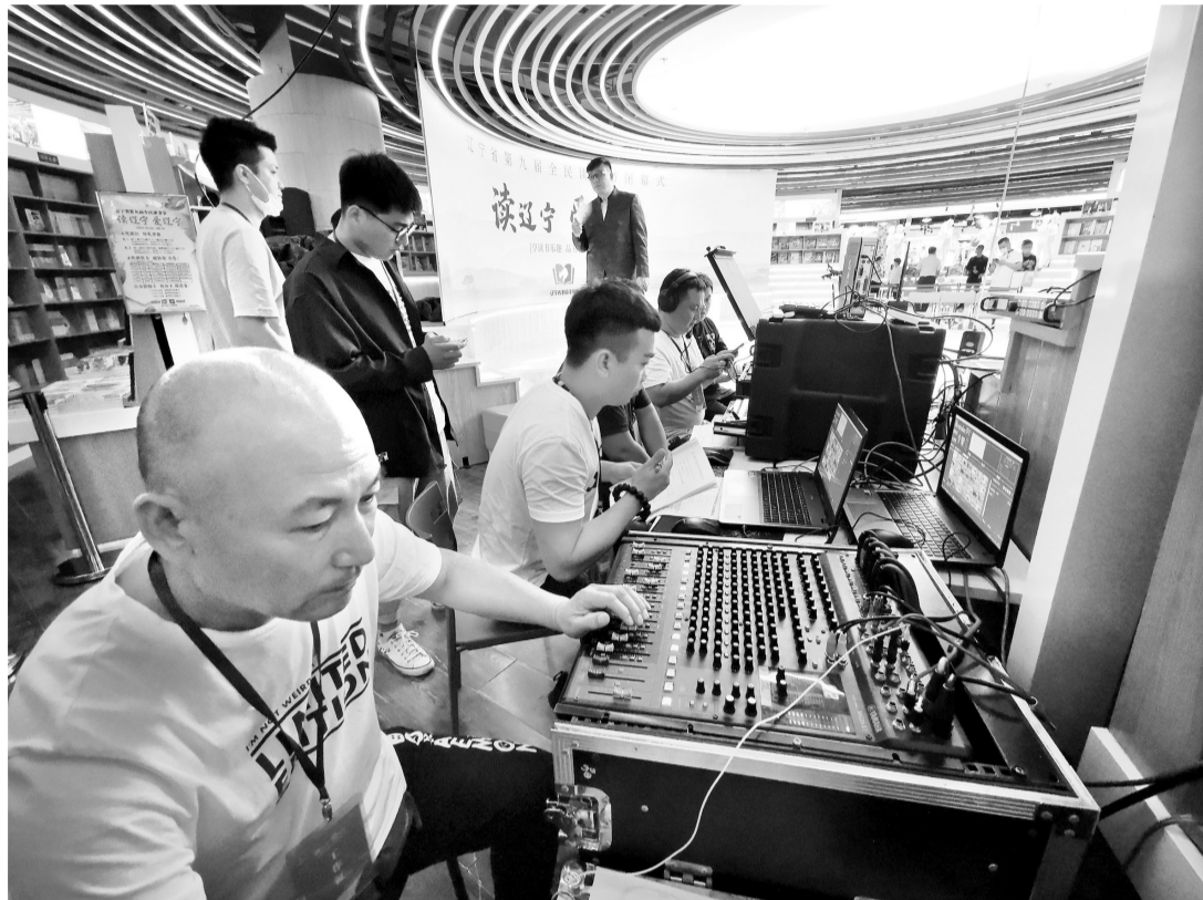
省第九届全民读书节闭幕式现场。

读书节组委会邀请有经验的媒体人和策划高手参与到读书节活动策划当中,围绕“读辽宁,爱辽宁”精心设计三大重点活动——“课本中的辽宁”“主题图书诵读”“14城阅读接力”。活动别具一格,基层群众热烈响应,各地群众用文字、照片、音频、视频等多种形式参与到活动中,仅省读书节组委会收到的读书节活动作品就有2000多份。省作协、省文联、辽宁日报社共同举办的“读辽宁,爱辽宁”主题诗歌征文活