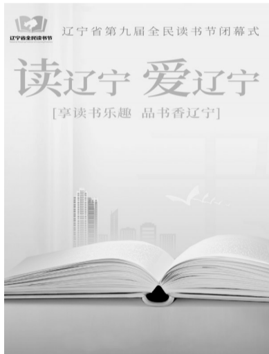
省第九届全民读书节闭幕海报。