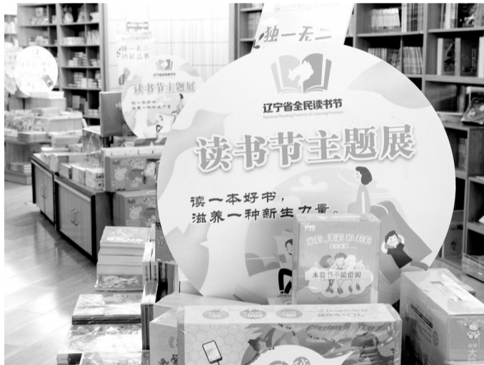
读书节主题展现场。