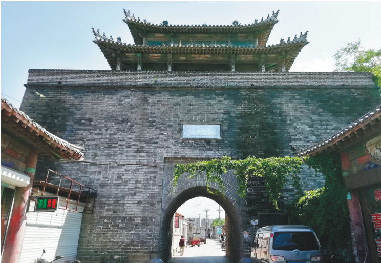
熊岳古城北城门楼外景。

熊岳古城内的道路布局也特点鲜明，除了一条南北大道，东西方向只有在城内中心偏南处，有一条直通的小土路，其余均为“丁字路”，错落有致，每条丁字路相距几乎都在百米左右。