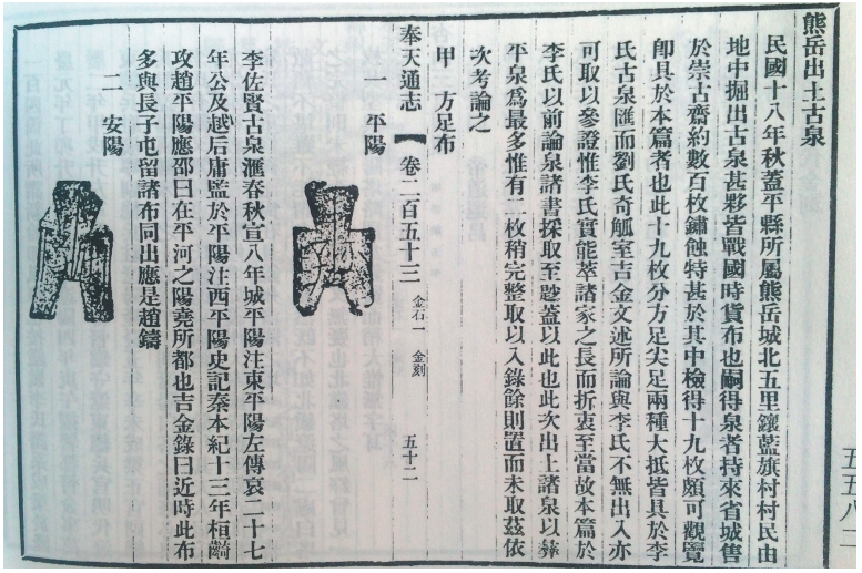
《奉天通志》记载熊岳出土古钱。(阎海供图)

顺着南北大街，穿过已残损的南城门遗址，记者眼前豁然开朗，一条宽阔的大河横亘面前——这就是熊岳河。史料记载，古城原来设有护城河绕城一周，与城南的熊岳河相通。