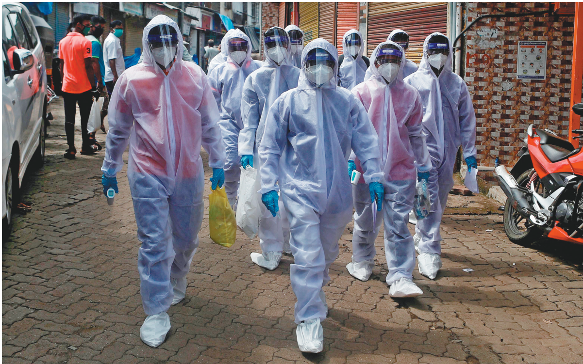
6月27日,医务人员在印度孟买进行新冠病毒检测工作。

据新华社新德里6月27日电(记者赵旭)印度卫生部27日最新数据显示,过去24小时印度新增新冠确诊病例18370例,新增死亡病例383例。截至当地时间27日8时(北