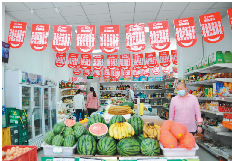
社区超市既方便了居民生活又扩大了就业。

5月份,鞍山市新登记企业875户,同比增长14.98%。在新登记市场主体中,个体工商户增幅最大,新登记4110户,同比增长32.15%。其中第一产业占比15.55%,第二产业占比8.32%,第三产业占比76.13%。