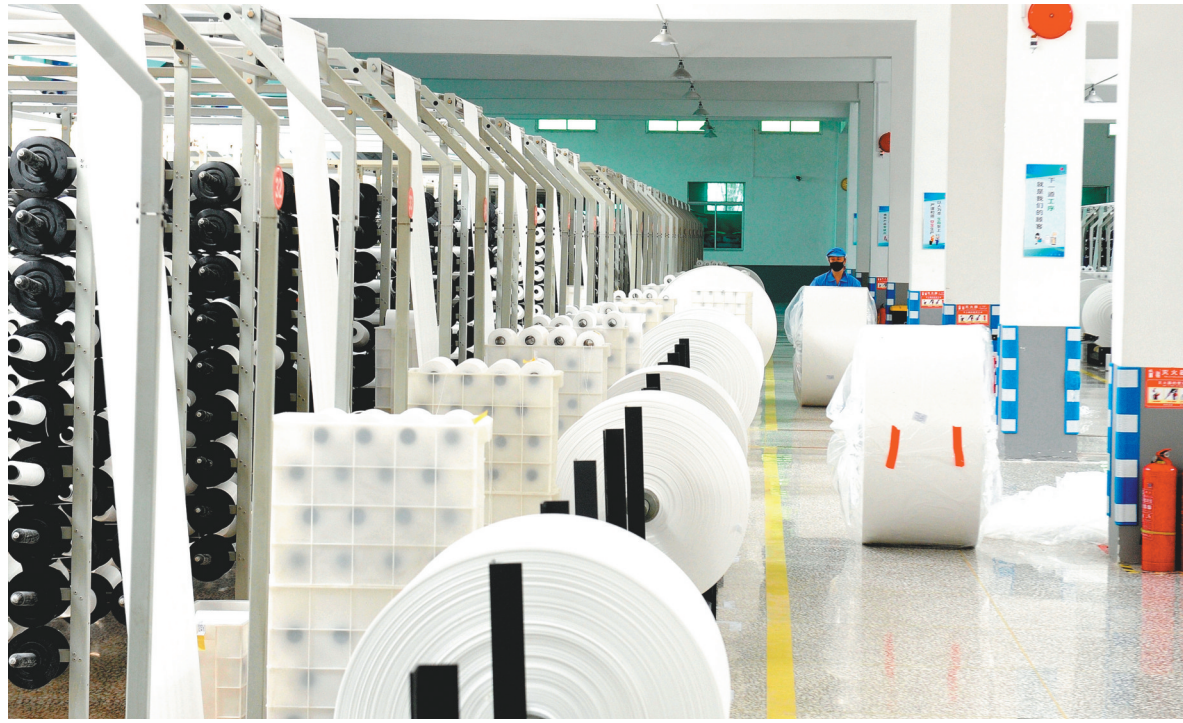
辽宁弘业永盛包装有限公司车间生产忙。

在发展平台经济方面,鞍山市以引进国内外知名电商品牌与培育本地自建平台两种方式,激发优势产业创新活力,深挖就业新