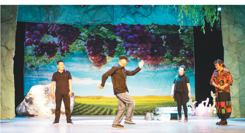
影调戏《香槐岭的笑声》剧照。

复工复产以来,我省各地艺术团积极排演新剧目,其中既有歌舞剧,也有地方戏。记者从凌源市文化旅游广电局了解到,新创影调戏《香槐岭的笑声》日前在凌源排演。该剧舞台版排练完成后,凌源市文化旅游广电局正在组织拍摄同名微电影。