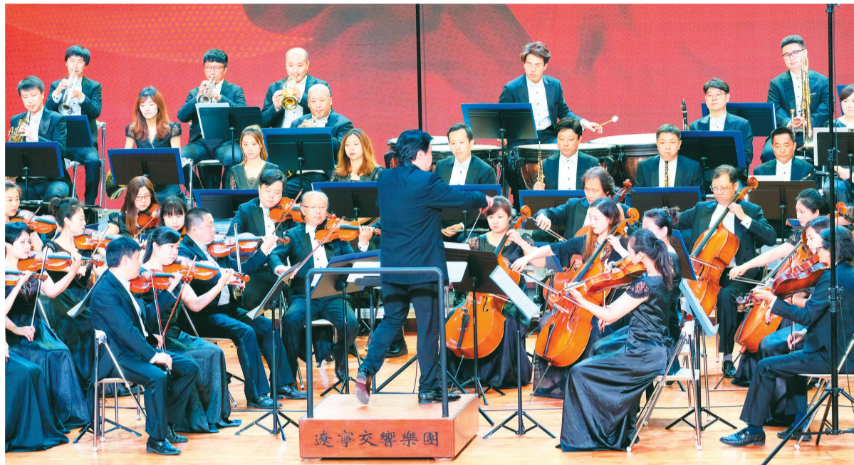
艺术家倾情演出“云音乐会”。

现场大屏幕上,播放了开罗交响乐团艺术家们居家演奏的小视频,让人感动。做好交响乐“云合作”给中埃两国艺术家带来挑战。隔空合作一场交响音乐会的难度不小,我国的艺术家们进行现场演奏,而埃及的艺术家们因受疫情影响,无法进行正常排练及合奏,因此他们先各自在家录制好演奏片断,最终经过反复剪辑、合成,与现场演奏的中国艺术家共同完成演奏。