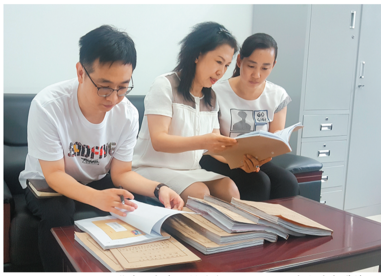
纪检监察干部在研判对受处理处分的干部教育帮带情况。

抚顺市纪委监委指定受处理处分的干部所在单位为责任单位，由其党委(党组)为受处理处分的干部安排一名帮带人，负责谈话、疏导。指定派驻纪检监察组不定期跟踪回访，促进教育帮带精细精准，做到“一把钥匙开一把锁”。纪检监察机关对教育帮带工作“回头看”，有效解决了受处理处分的干部所在单位置之不理的普遍问题。