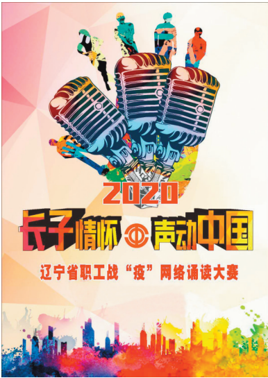
省总工会举办战“疫”网络诵读大赛。