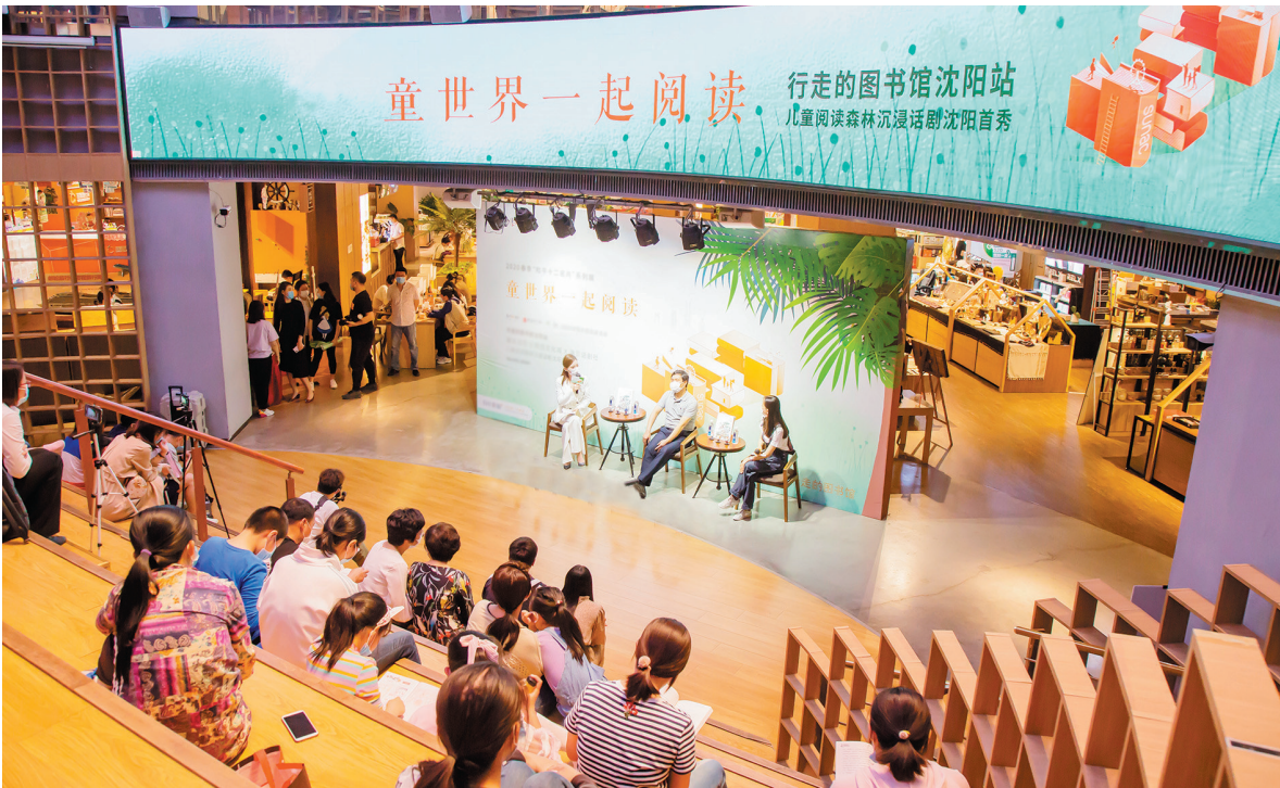
沈阳市“云端读书节”在举办“童世界一起阅读”系列活动。