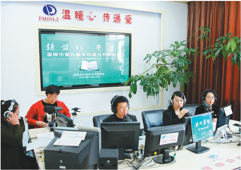
锦州市第九届全民读书“云”上启幕。

省委宣传部推出“战疫书柜”微信小程序,省总工会组织开展辽宁省职工战“疫”网络诵读大赛直播展示,省残联在全省残疾人和残