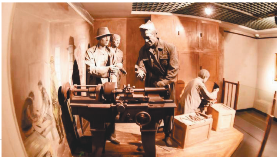
陈列馆里的复原场景。

6月9日,沈阳二战盟军战俘营旧址改造工程结束,重新对外开放。记者走入大门,映入眼帘的是水塔和烟囱,这是战俘营里最高的建筑。改造后的陈列馆陈列展分为“序厅部分”“沈阳盟军战俘营的历史背景”“沈阳盟军战俘营的设立”“盟军战俘在奉天战俘营中的遭遇”“沈阳盟军战俘营的解放”5个部分。500余幅历史图片、近百件文物史料,真实再现了战俘营设立的历史和战俘苦难的生活与抗争。