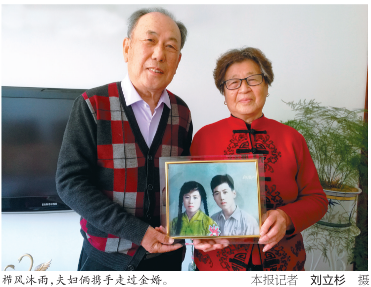
栉风沐雨，夫妇俩携手走过金婚。

校在瑟瑟寒风中，我们就担心得睡不着。反倒是她安慰我们：“放心吧，凭女儿的智慧加上妈妈的耳提面命，不会有问题的。” 现在每提及此事，三姐妹都很感慨，“当时油田就业很容易，如果不是父母坚持供我们读书，可能就不会有今天的成就了。”邹增积毕业后被分配到辽河油田金马公司工作，从最小的政工干事做起，现在已经成长为单位的中层干部。