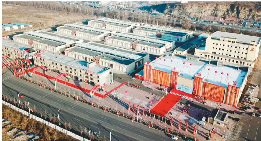
“双凌”协同发展示范区内的锦州思凯农副产品国际物流园建成并投入使用。

同时,锦州市对入驻示范区的项目出台了大量利好政策。入驻示范区的项目将享受市级审批权限和省级“飞地经济”政策;全市各部门将积极协助入驻单位申报项目,争取国家、省、市关于鼓励创新创业的相关政策和资金支持……优质的政策不断吸引区域外各类产业来到“双凌”