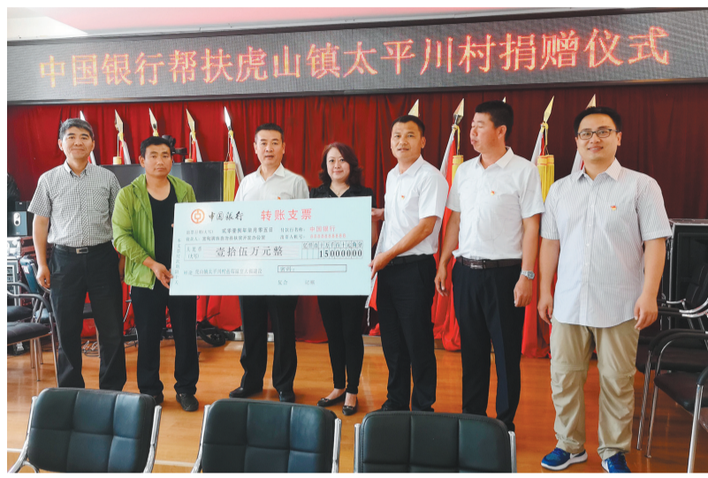
中行辽宁省分行向宽甸县虎山镇太平川村捐赠专项扶贫资金15万元。(资料片)

2016年以来,中行辽宁省分行党委围绕省、市定点扶贫发展战略,与省、市级扶贫部门积极对接,结合贫困地区区域发展特点,实施精准扶贫,取得显著成效。截至2019年末,扶贫贷款余额12.4亿元,共向全辖9个定点扶贫村无偿投入扶贫资金178万元,实施定点扶贫项目20个,向定点扶贫村派出专兼职扶贫干部10人,帮助全省682户1820人实现整体脱贫。