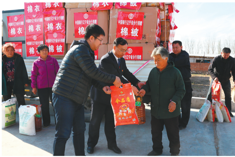
中行辽宁省分行员工春节前慰问阜新县建设镇三合堂村贫困户。(资料片)