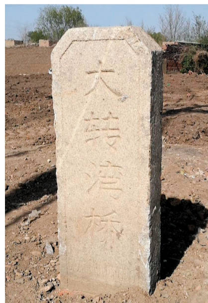
位于沈阳市于洪区,大御路在此转弯。