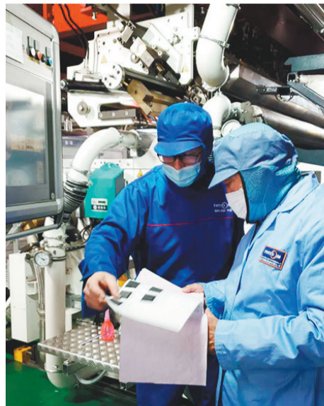
朝阳佛瑞达公司工作人员在看图纸。