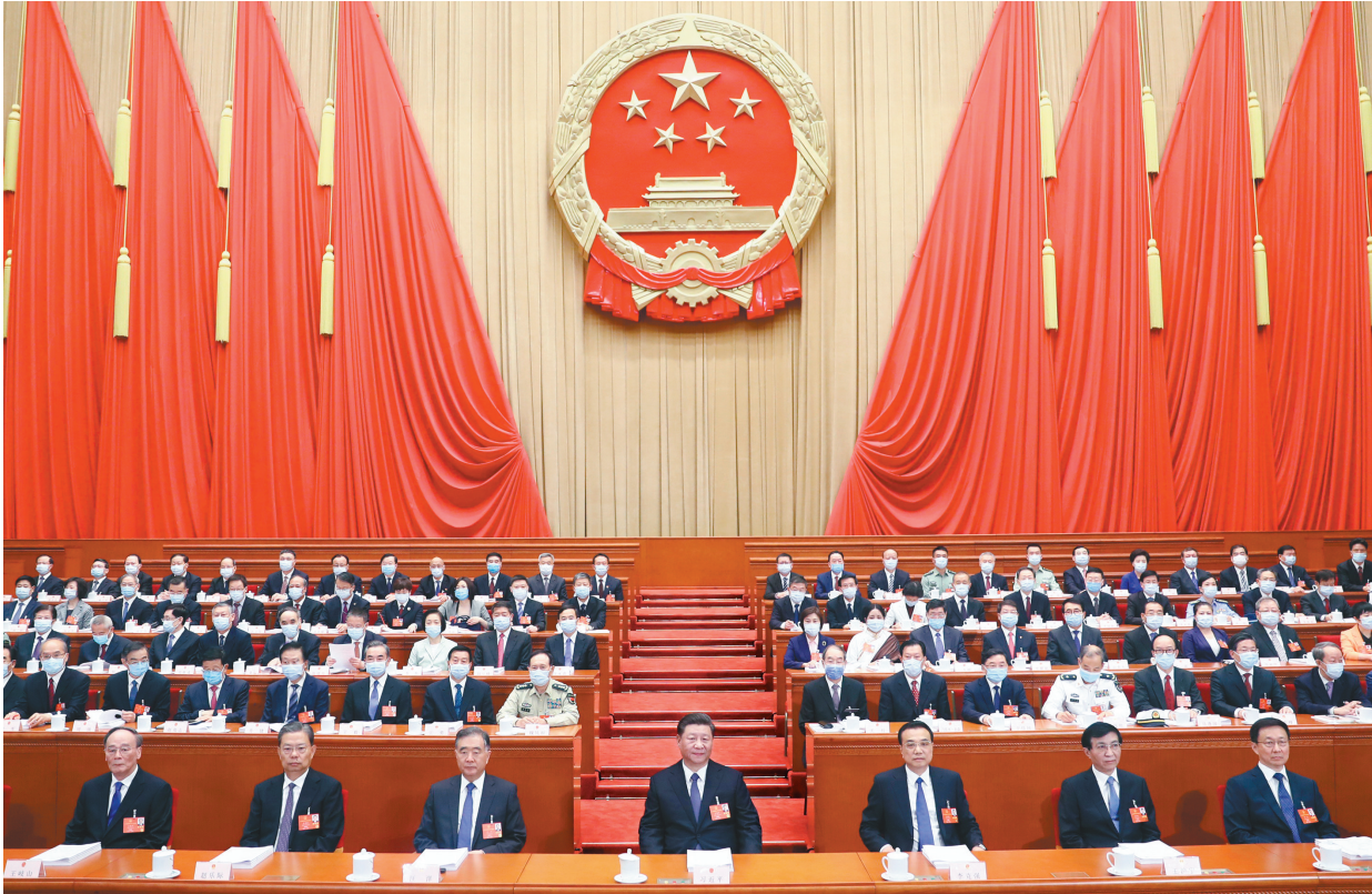
5月22日,第十三届全国人民代表大会第三次会议在北京人民大会堂开幕。党和国家领导人习近平、李克强、汪洋、王沪宁、赵乐际、韩正、王岐山等出席,栗战书主持大会。

新华社北京5月22日电 第十三届全国人民代表大会第三次会议22日上午在人民大会堂开幕。近3000名全国人大代表肩负人民重托出席大会,认真履行宪法和法律赋予的神圣职责。 人民大会堂万人大礼堂气氛庄重,主席台帷幕正中的国徽在鲜艳的红旗映衬下熠熠生辉。 大会主席团常务主席、执行主席栗战书主持大会。大会主席团常务主席、执行主席王晨、曹建明、张春贤、沈跃跃、吉炳轩、艾力更·依明巴海、万鄂湘、陈竺、王东明、白玛赤林、丁仲礼、郝明金、蔡达峰、武维华、杨振武在主席台执行主席席就座。 习近平、李克强、汪洋、王沪宁、赵乐际、韩正、王岐山和大会主席团成员在主席台就座。 十三届全国人大三次会议应出席代表2956人。22日上午的会议,出席2897人,缺席59人,出席人数符合法定人数。 上午9时,栗战书宣布:中华人民共和国第十三届全国人民代表大会第三次会议开幕。