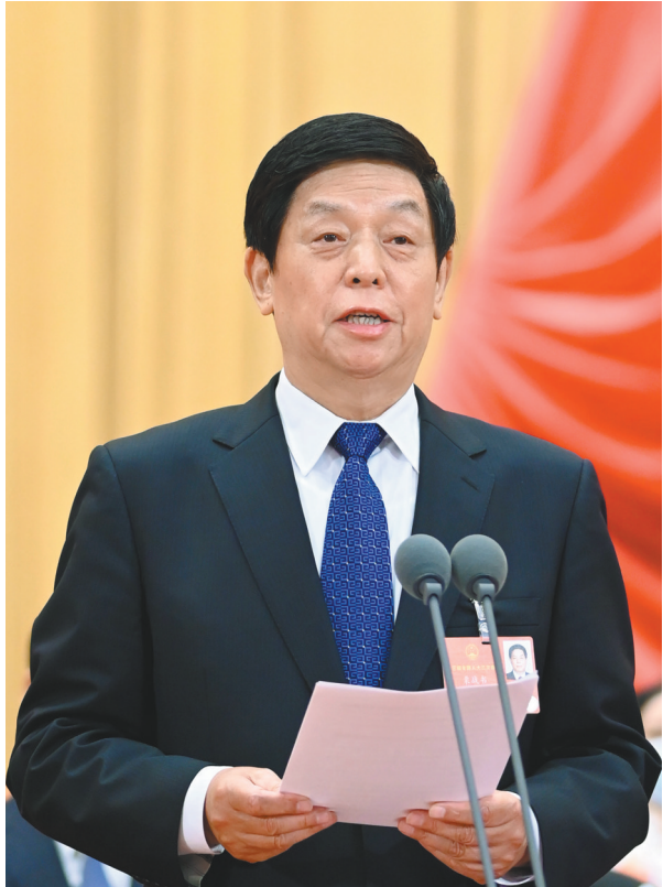
大会主席团常务主席、执行主席栗战书主持大会。

生,推动社会事业改革发展。 李克强说,这次新冠肺炎疫情,是新中国成立以来我国遭遇的传播速度最快、感染范围最广、防控难度最大的公共卫生事件。在以习近平同志为核心的党中央坚强领导下,经过全国上下和广大人民群众艰苦卓绝努力并付出牺牲,疫情防控取得重大战略成果。当前,疫情尚未结束,发展任务异常艰巨。要努力把疫情造成的损失降到最低,努力完成今年经济社会发展目标任务。 李克强对2019年和今年以来的工作进行了回顾:经济运行总体平稳;经济结构和区域布局继续优化;发展新动能不断增强;改革开放迈出重要步伐;三大攻坚战取得关键进展;民生进一步改善。新冠肺炎疫情发生后,党中央将疫情防控作为头等大事来抓,习近平总书记亲自指挥、亲自部署,坚持把人民生命安全和身体健康放在第一位。在疫情防控中,我们按照坚定信心、同舟共济、科学防治、精准施策的总要求,抓紧抓实抓细各项工作。