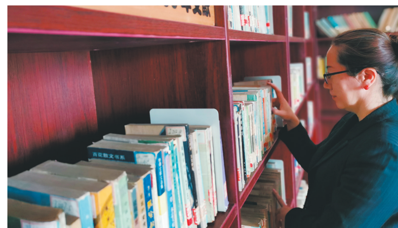
在“拾光书房”寻找心仪的老书。

此时,阳光照在书房可以看到风景的窗台上、书架上,也照在门口艺术感浓郁的徽标上。戴着口罩的读者彼此间隔坐着埋头读书,还有的在书架上寻找着自己心仪的图书。一排排错落有致的书架上摆放整齐的书籍大多老旧泛黄,颇有年代感,从自然科学到文学、艺术、人文、历史等,类别广泛,最老的应该就是陈列柜里的一套1927年出版的《英汉大辞