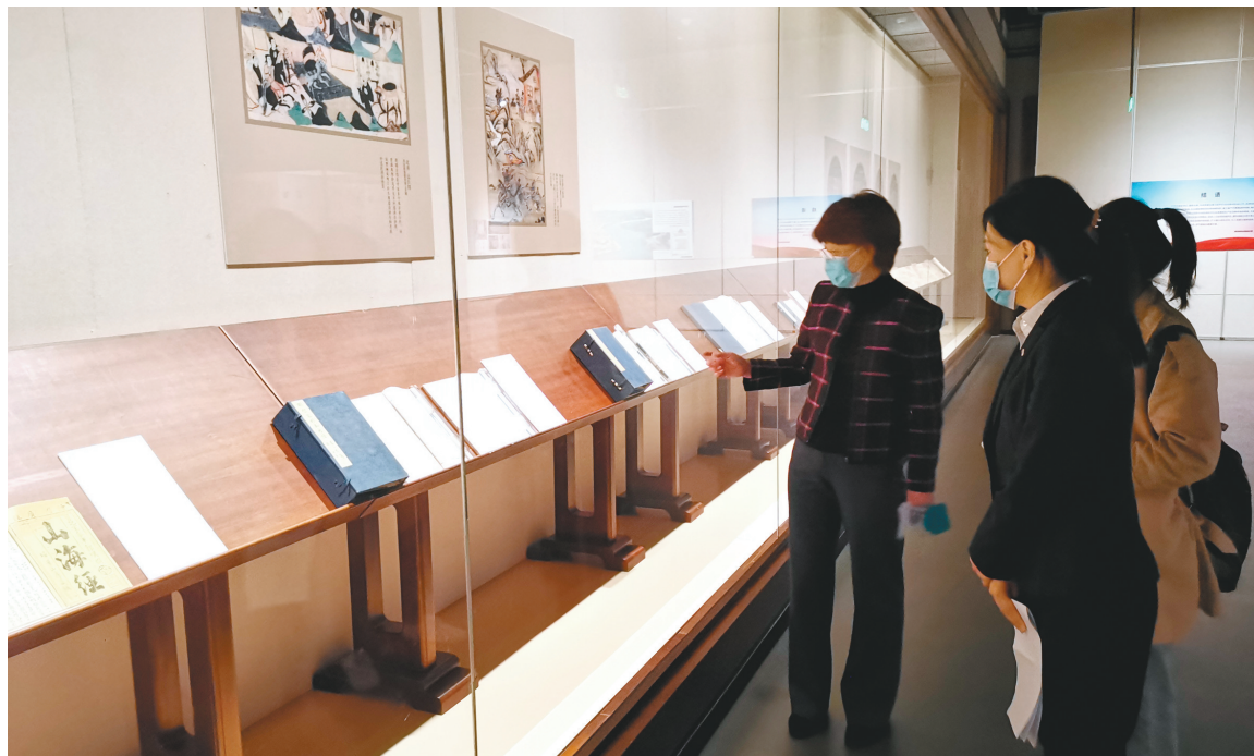
此展负责人(左一)在现场为观众讲解。

核心提示 5月18日,由国家文物局支持,中国文物交流中心和辽宁省文化演艺集团(省公共文化服务中心)主办,辽宁省博物馆和辽宁省图书馆承办的“启示——人类抗疫文明史”主题展览在辽宁省博物馆开展,此展全面地梳理了人类抗疫文明史。这是省博物馆继“文物系荆楚 祝福祖国”接力海报展之后,在“国际博物馆日”系列活动中,推出的又一个战“疫”主题展览。 5月18日,经过省博物馆“两码一证”,即预约码、健康码和身份证安检后,记者走进辽宁省博物馆一层1号临时展厅,看到《黄帝内经》《山海经》、彩陶双耳罐、仇英的《清明上河图》等古籍文物及早期的光学显微镜图解等图文展板。