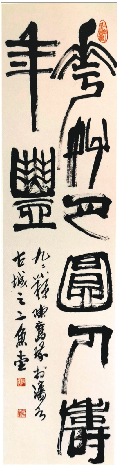
书法《花好月圆人寿年丰》