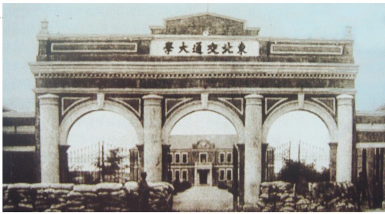
东北交通大学校门老照片。

在遗址公园北侧,书声琅琅,锦州铁路高中的学子孜孜不倦,正在苦读;南侧,列车隆隆,一趟趟火车昼夜不息,南来北往。习惯了风云变幻的东北交通大学在这片土地上日夜守望,见证着不断演进的时代和这个瞬息万变的世界。