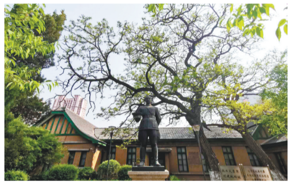
东北交通大学遗址公园内新竖立的张学良雕像。