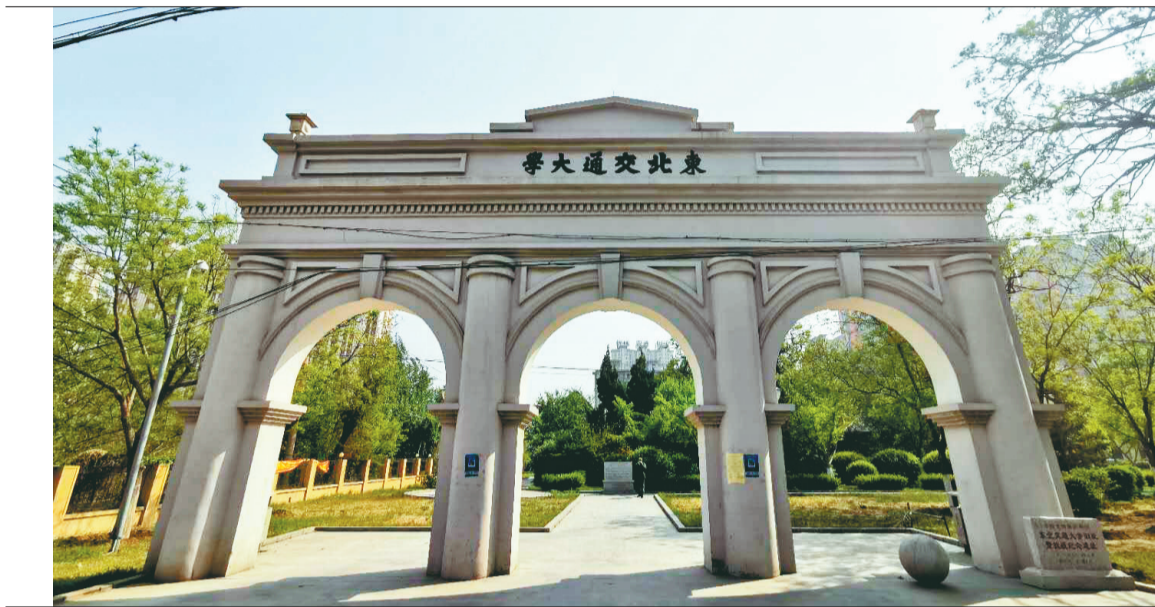
按照1:1比例复建的东北交通大学校门。