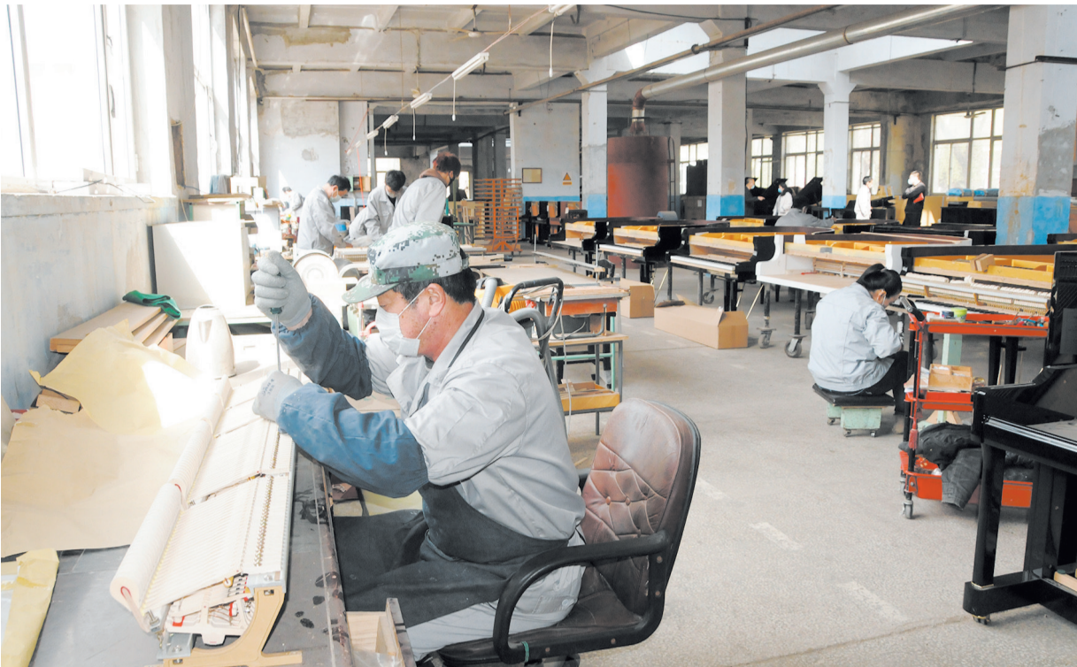
“东北钢琴”老厂房复建的新车间。

在保障企业工作人员安全的前提下有序推进复工复产,营口乐器人有着自己的思路和方法。春潮中,营口乐器产业正在演奏独特律动的复工进行曲。