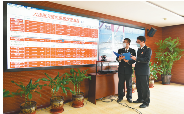
海关关员通过预警系统监控进境船舶。