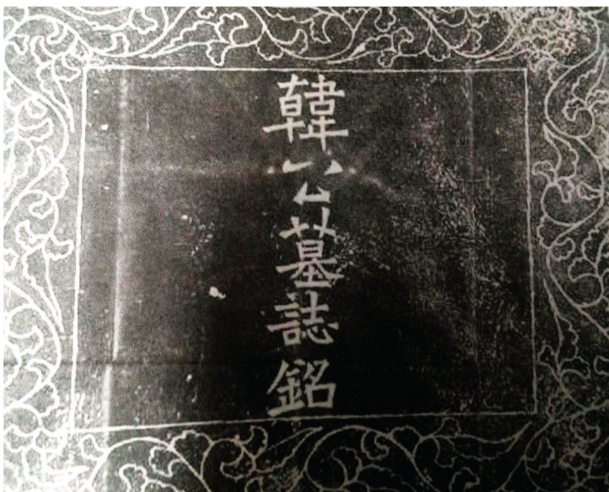
韩榭墓志盖。(现藏于朝阳博物馆)