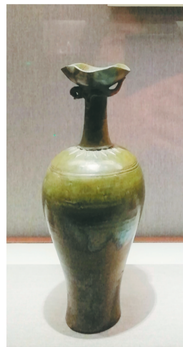
辽代风首瓶，反映民族文化交融。