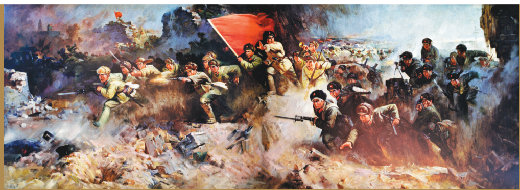
《攻克锦州》布面油画 1961年 150cm x 310cm 中国国家博物馆藏