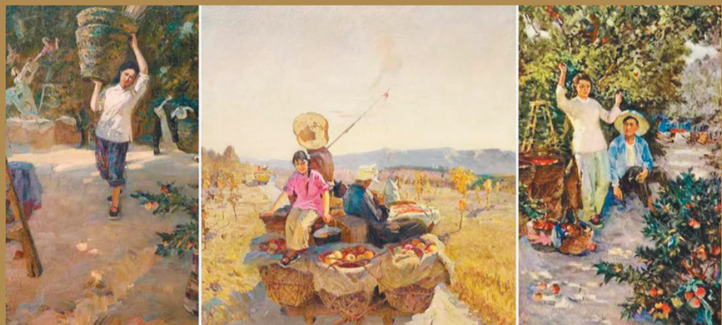
《收获的季节》布面油画 1957年 120cm x 240cm 中央美术学院藏