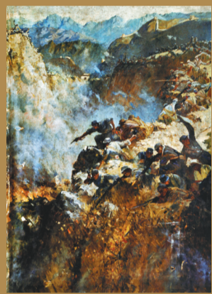
《平型关大捷》布面油画 1959年 235cm x 160cm 中国人民革命军事博物馆藏