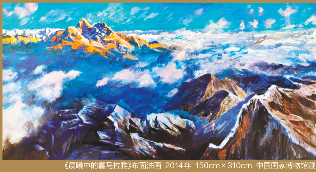
《晨曦中的喜马拉雅》布面油画 2014年 150cm x 310cm 中国国家博物馆藏