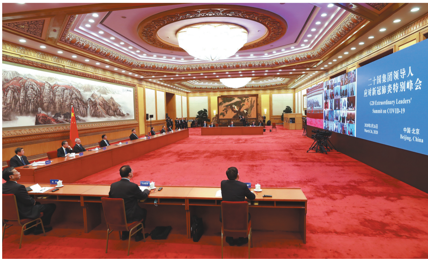
3月26日,国家主席习近平在北京出席二十国集团领导人应对新冠肺炎特别峰会并发表题为《携手抗疫 共克时艰》的重要讲话。

新华社北京3月26日电 (记者杨依军) 国家主席习近平26日晚在北京出席二十国集团领导人应对新冠肺炎特别峰会并发表题为《携手抗疫 共克时艰》的重要讲话。习近平强调,面对突如其来的新冠肺炎疫情,中国政府、中国人民不畏艰险,始终把人民生命安全和身体健康摆在第一位,按照坚定信心、同舟共济、科学防治、精准施策的总要求,坚持全民动员、联防联控、公开透明,打响了一场抗击疫情的