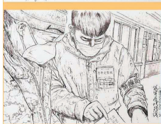
刘谦《筑牢疫情防线》之一