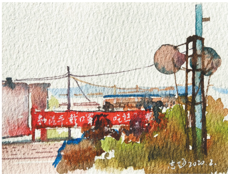
孙志超《锦州抗疫之乡村篇》