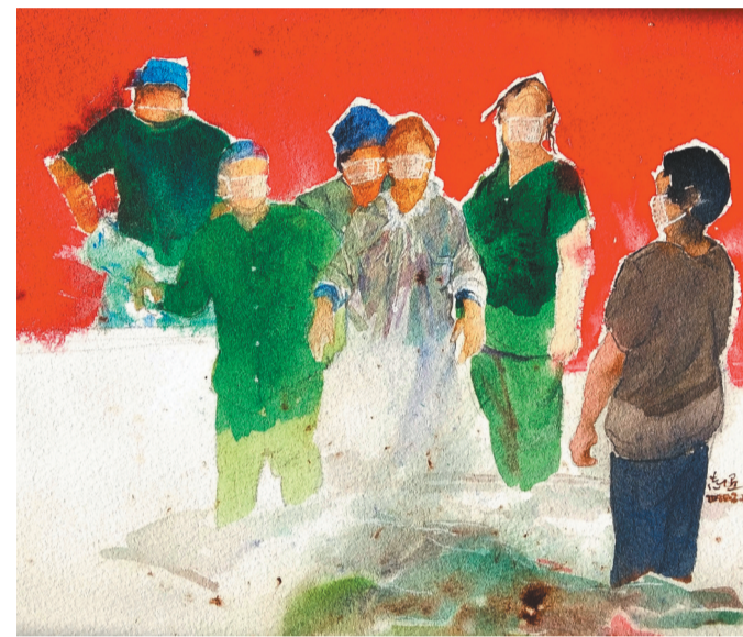
孙志超《抗击疫情之换装》