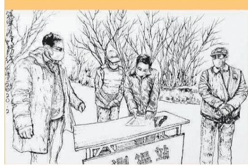
刘谦《筑牢疫情防线》之二