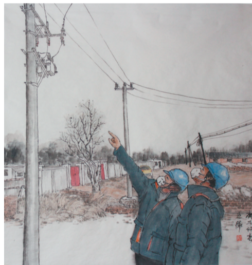
翟立军《战疫情—保供电》