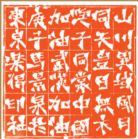
马景泉 山川异域风月同天 岂曰无衣与子同裳 中国加油 武汉加油