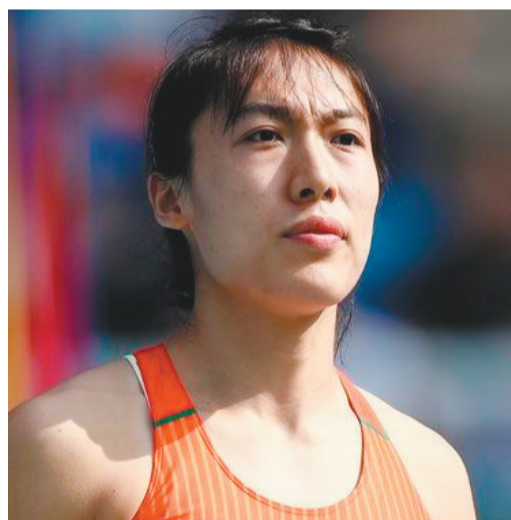
吕会会(中国田径队女子标枪运动员)