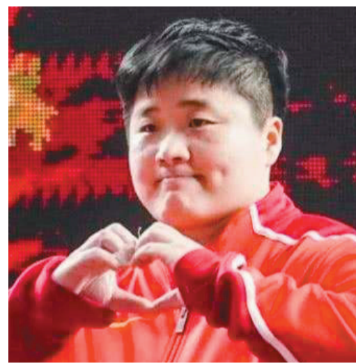
巩立姣(中国田径队女子铅球运动员)

我们要做好抗击疫情的准备,向一线的医务人员和工作人员致敬!为武汉加油,为中国加油!