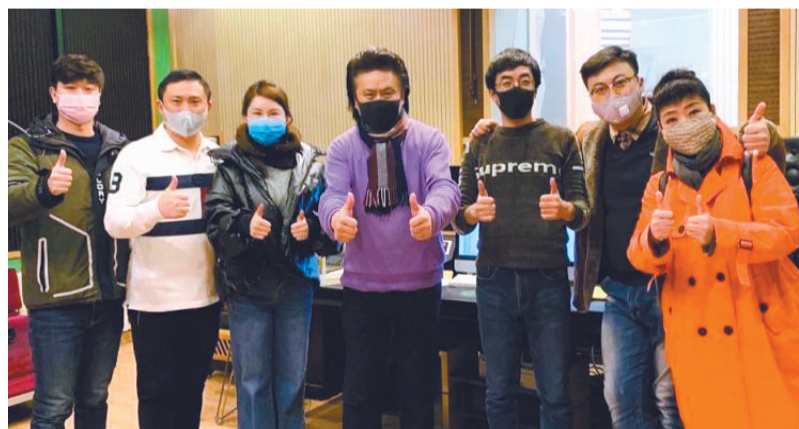
歌曲《奉献·担当》主创团队

本报 记者赵乃林报道 春节后复工伊始,辽宁省广播电视局在最短时间即推出全省疫情防控主题广播歌曲、广播剧和科普动漫短片展播3项活动,全省各级各类广播电视播出机构、网络视听平台、社会制作机构及相关团体和个人积极响应。辽宁广播电视台、沈阳广播电视台等重点播出机构已完成首批歌曲和广播微剧创作生产。经过审核评选,2月11日起,省、市、县三级广播电台已在覆盖广、影响力大的主频率、文艺频率、交通频率黄金时段,集中播出了《武汉加油》《武汉不哭》等歌曲、《祝福》《我叫中国人》等微剧节目,辽宁影视网等网络视听平台同步推送,全省网上网下、各级机构同频共振、立体发声。从2月12日起,“学习强国·辽宁频道”每天推送1部参展广播剧。