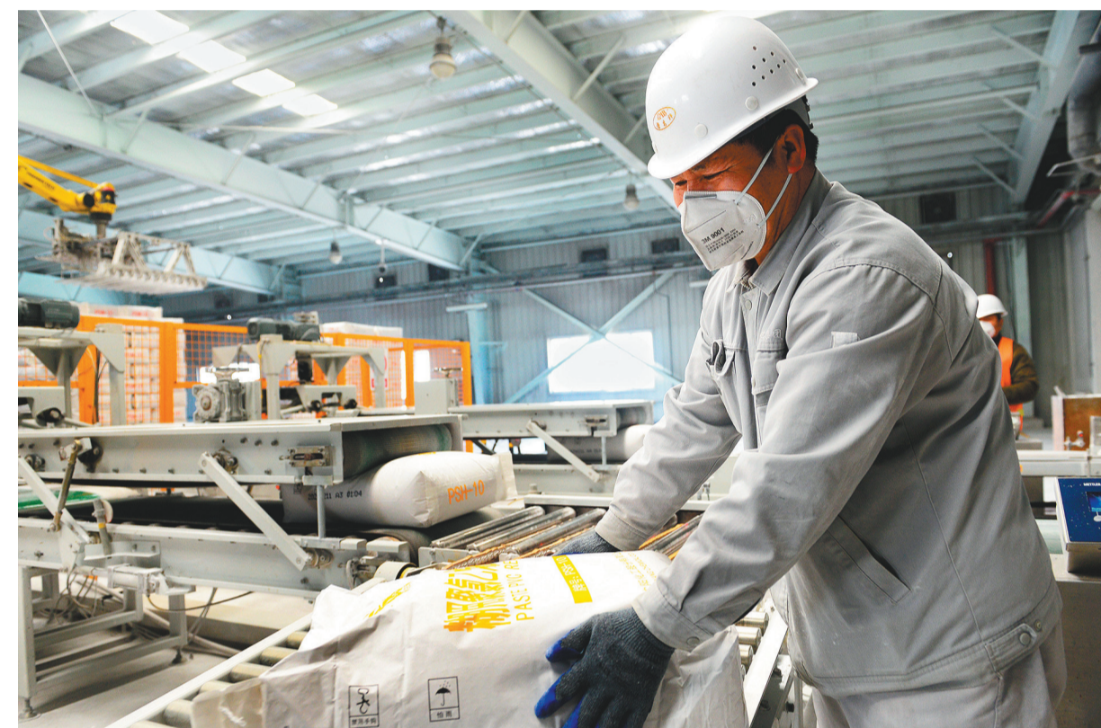
沈阳化工集团有限公司的员工加紧生产保障市场供应。

本报讯 记者金晓玲报道 记者2月12日获悉:在目前日产240吨、创建厂82年来最高纪录的基础上,沈阳化工集团有限公司进一步提升次氯酸钠的生产能力,向日产300吨发起冲击,全力为辽宁乃至东北抗击疫情提供物资保障。