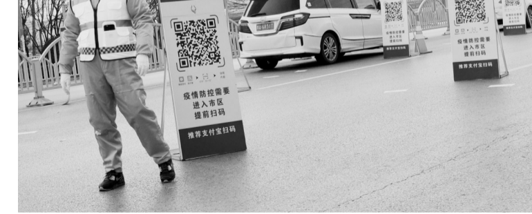
这是郑州市商都路检查站设置的扫码登记处(2月4日摄)。近日，河南省交警部门在郑州市各入城路口设置检查站，进城人员可扫描二维码进行车辆和人员等信息登记。