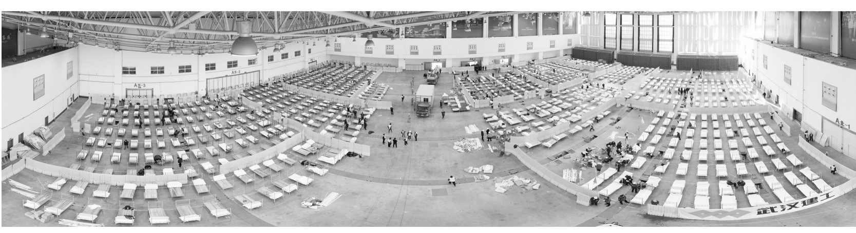
这是2月4日拍摄的改造中的武汉客厅内部全景照片(无人机照片)。2月3日晚，3所“方舱医院”在武汉开建，至4日早上，已搭起数百张临时病床。这3处“方舱医院”位于武汉国际会展中心、洪山体育馆和武汉客厅，以收治新型冠状病毒感染的肺炎轻症患者为主，将提供3400张医疗床位。