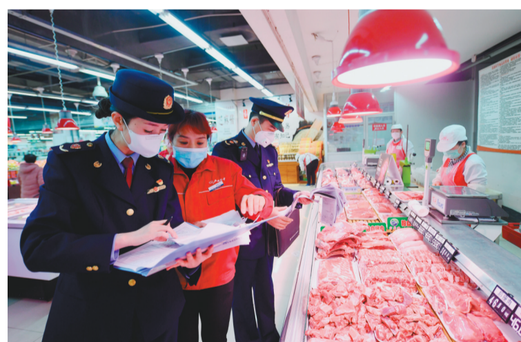
2月3日，石家庄市桥西区市场监督管理局工作人员对一家超市销售的肉类进行价格检查。

连日来，河北省石家庄市桥西区市场监督管理局开展新型冠状病毒感染的肺炎疫情防控专项检查，对部分商品进行重点监测，加强价格检查、巡查和提醒告诫，稳定市场物价。