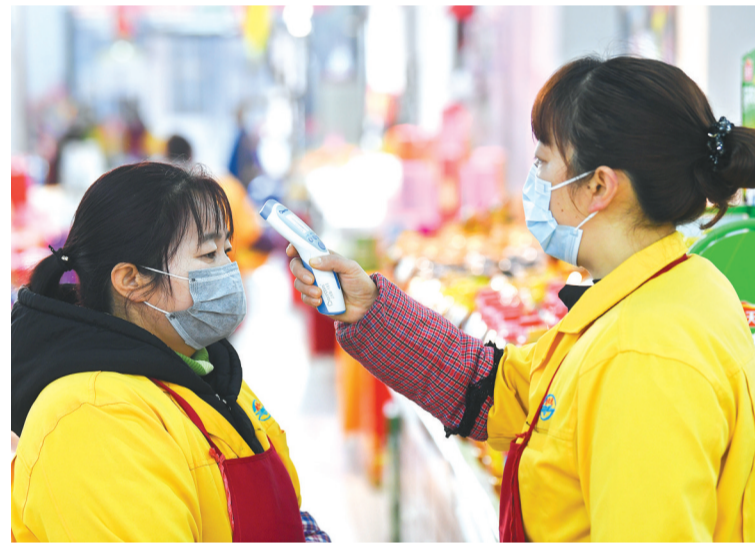
1月30日,重庆市万州区龙沙镇一家商场,工作人员在给同事测量体温。近日,各地采取多种措施,加强对新型冠状病毒感染的肺炎疫情防控工作。