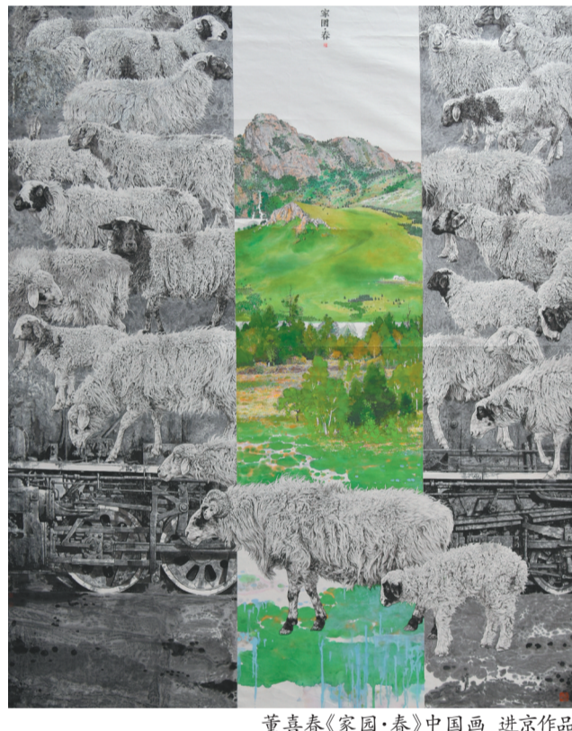
董喜春《家园·春》中国画 进京作品