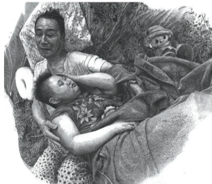
李非《姐姐》(部分) 连环画 铜奖