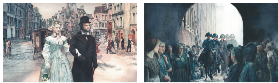
沈璐《马克思》(部分) 连环画 银奖