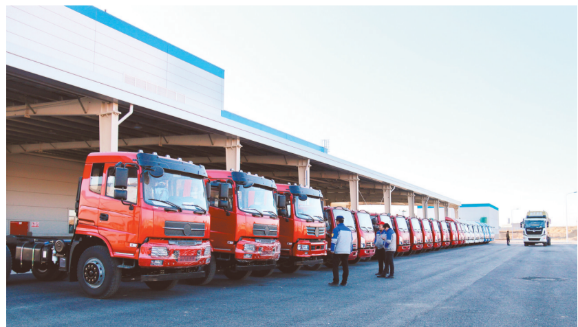
航天凌河汽车生产的重卡、轻卡。

凌河新能源商用车3个整车生产资质。以“三部车”为牵动,大力引进专用车、特种车以及汽车零部件项目,以航天科技集团科研和技术优势,积极发展氢能商用车,推动汽车制造全产业链发展。通过近几年的培育,产业的发展已实现新旧动能转化,一汽凌源在传统轻卡生产的基础上,又大幅增加了皮卡、纯电动轻卡、洒水车、垃圾清运车等,涵盖了商用车领域多种车型,建立了完整的产业体系。航天凌河汽车现已建成并投入生产,以航天技术研发优势,在重卡、轻卡、军车等研发、生产基础上,又成功获取了国家工业和信息化部新能源汽车的生产资质,这将为全市纯电动商用车的生产奠定坚实的基础,也为氢能车生产体系的建立埋下了伏笔。在培育两大龙头企业的同时,开发区又强化汽车零部件产业园平台建设,现产业园内已集聚富华专用车、凌宇重工特种车、恒瑞汽车冲压件、红山铝合金活塞和缸套、柳源汽车桥箱、连大星际汽车冲压件等汽车零部件企业30余家,产业配套体系日趋完善。计划到2025年,实现整车产能16万辆,汽车的零部件域内配套供应率达到60%以上,集群年产值达到220亿元以上,力争成为辽宁省乃至全国重要的商用车基地。