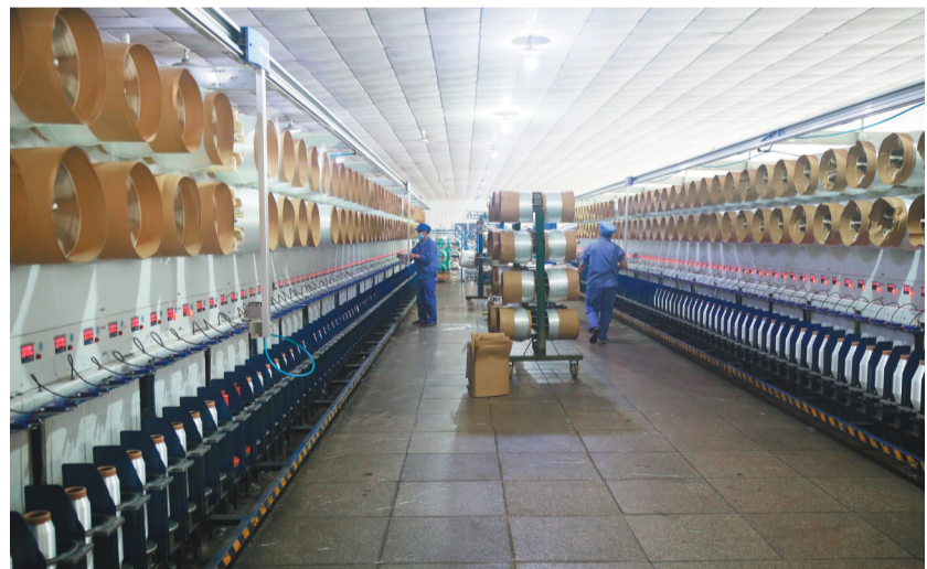
辽宁炜盛新型复合材料有限公司玻纤织布车间。

的成功效率。在创新工作衔接方式上,与市直部门建立协调联动、齐抓共管的工作机制。同时,开发区全力打造“亲”“清”的保姆式服务环境,服务效率和服务质量大幅提升;在薪酬分配上采取“基本工资+绩效考核工资”的管理模式,在干部提拔用人上,重点选拔任用年轻的优秀干部,完全打破事业身份限制,并已全面实施“五个一批”管理方式,形成了人员能进能出、岗位能上能下、待遇能高能低的用人机制。