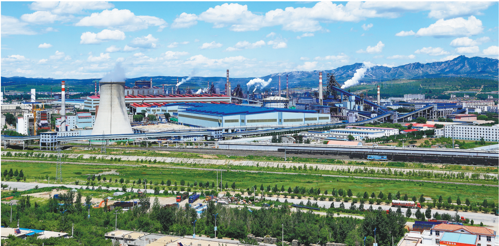
凌源钢铁集团厂区。