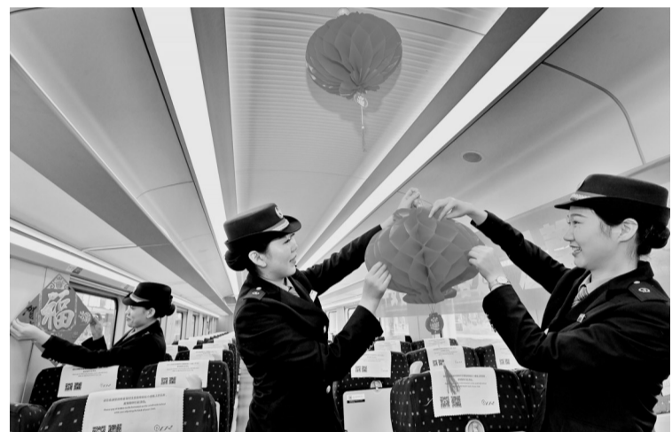
1月9日,福州开往北京的D760次动车组乘务员在装扮车厢。2020年春运即将开始,中国铁路南昌局集团有限公司福州客运段乘务员装扮车厢,为旅客营造舒适温馨的旅行环境。