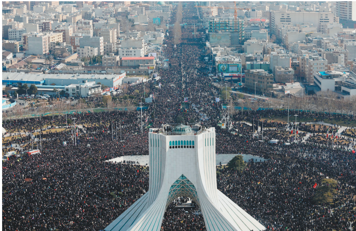
1月6日，在伊朗首都德黑兰，伊朗民众涌上街头为苏莱曼尼送行。

二是代理人策略。美方认为，伊朗在伊拉克、叙利亚、也门等国扶植代理人，可以借助武器援助、军事