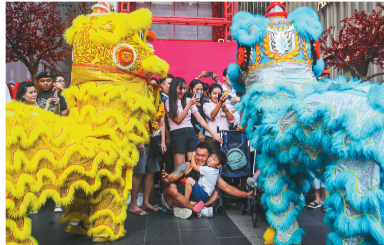
1月7日，在马来西亚吉隆坡，人们观看迎新舞狮表演。