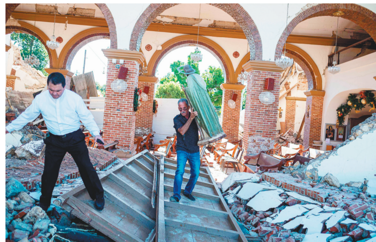
1月7日，在波多黎各南部城镇瓜亚尼亚，一所教堂在地震中被损毁。波多黎各附近海域7日发生6.4级地震，造成至少1人死亡。