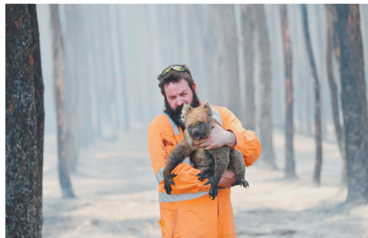
1月7日，在澳大利亚袋鼠岛，救援人员救出一只考拉。截至目前，这场大火过火面积约600万公顷，相当于两个比利时的面积。死于大火的哺乳动物、鸟类和爬行动物估计达5亿只。