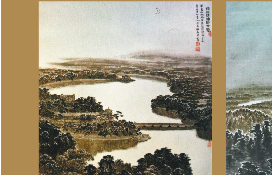
孙世昌《明月清辉照京华》2013年