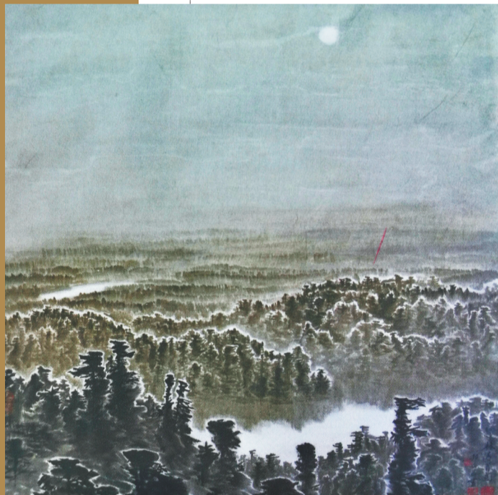
孙世昌《林海月色》1986年