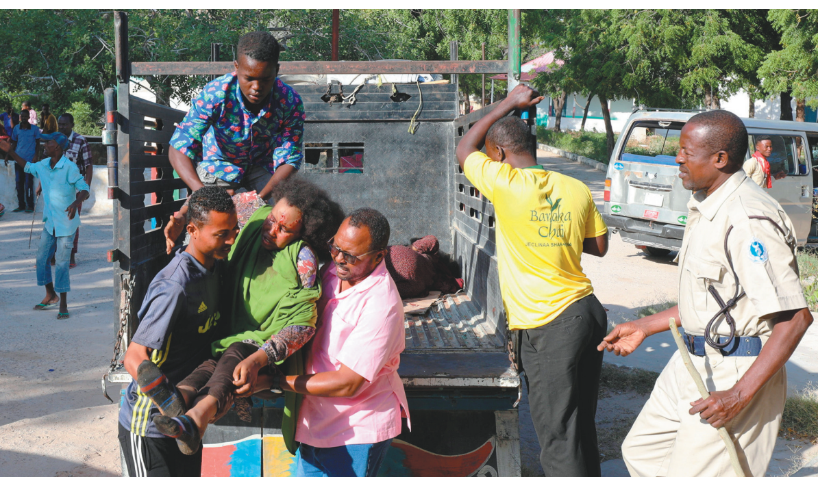
12月28日,在索马里摩加迪沙,汽车炸弹袭击事件伤者被送往医院。