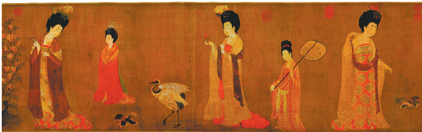
“又见大唐”书画文物展中展出的《簪花仕女图》