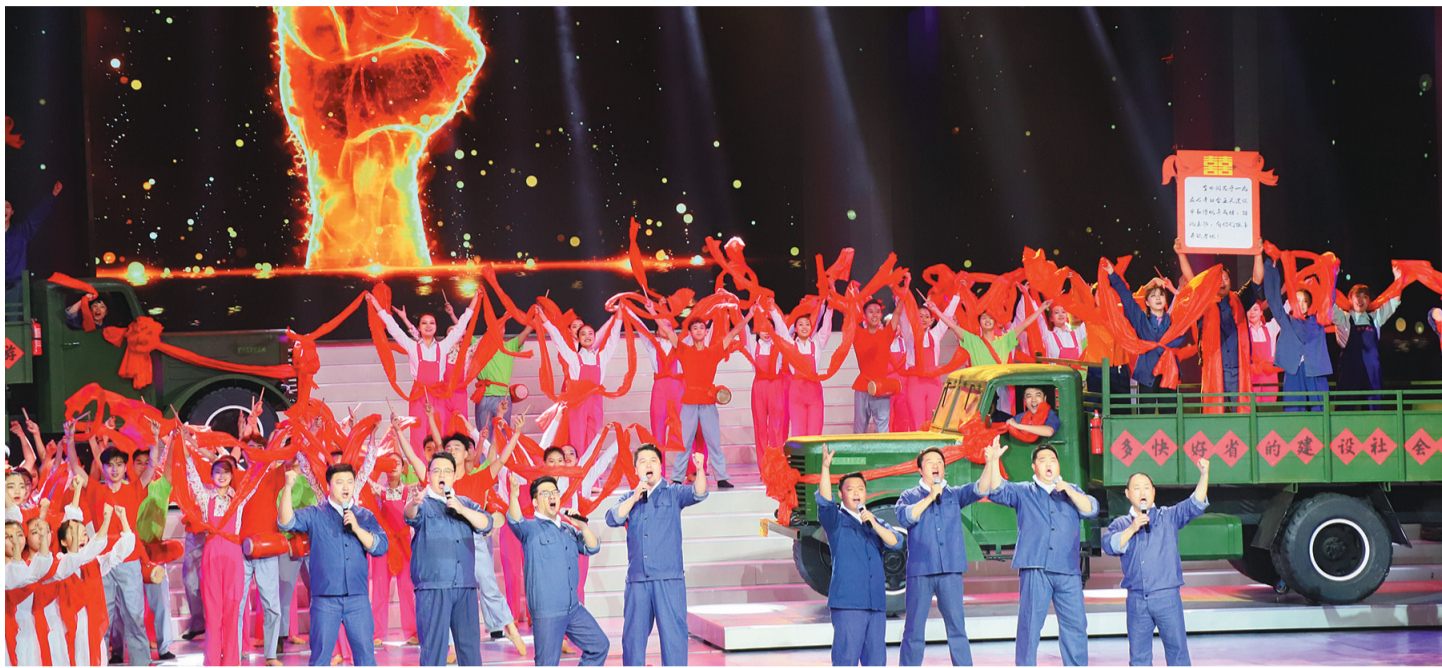
“我和我的祖国——辽宁省庆祝中华人民共和国成立70周年特别节目”现场

精品频出,好戏连台,这就是2019年的辽宁文艺现场,辽宁文艺在守正创新中为辽宁形象的全面提升创造更多“高峰”之作,必将为辽宁全面振兴、全方位振兴提供强大的价值引导力、文化凝聚力和磅礴推动力。