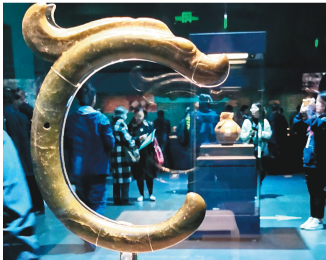
“又见红山”精品文物展现场