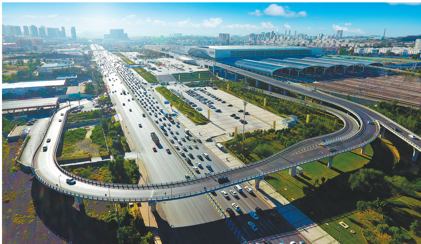
大连北立交天桥全景。