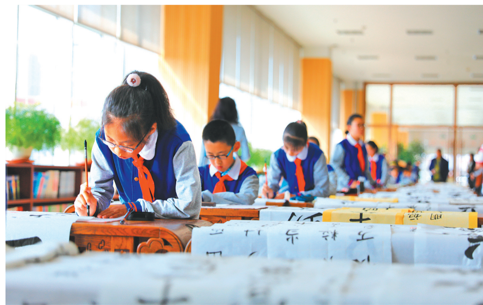
大连周水子小学学生进行书法表演。