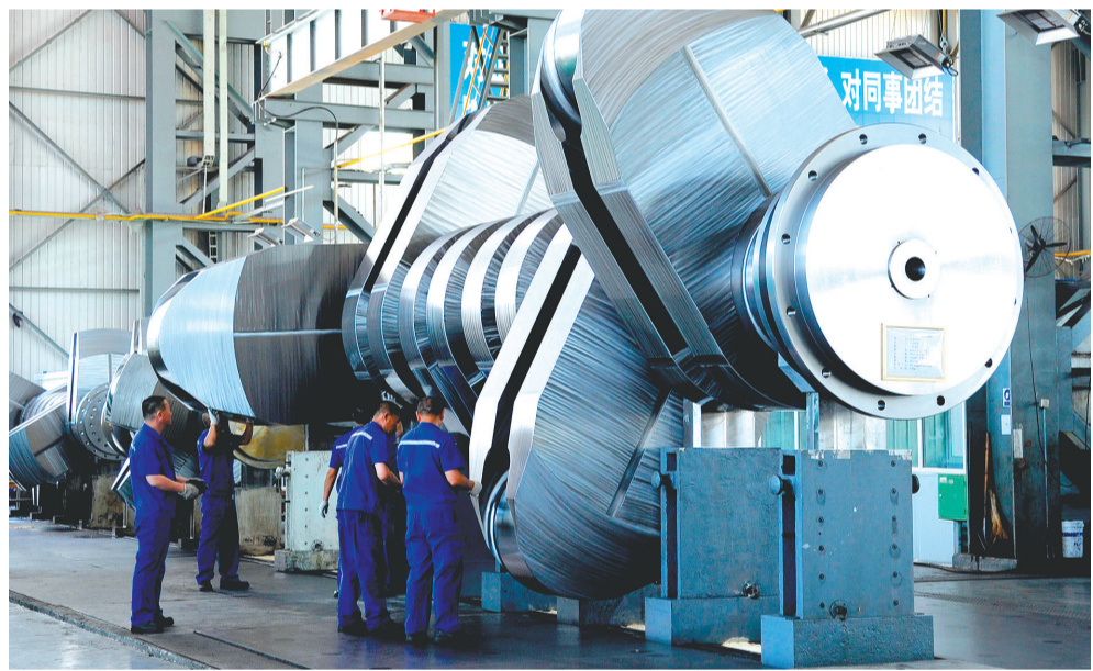
大连重工为大型智能原油船研制的7G80ME-C型曲轴。

在2019大连夏季达沃斯文化晚宴上,一匹巨大的“木牛流马”惊艳亮相。这匹能够行走、跃起、嘶鸣且面部表情丰富的巨马,不仅诠释