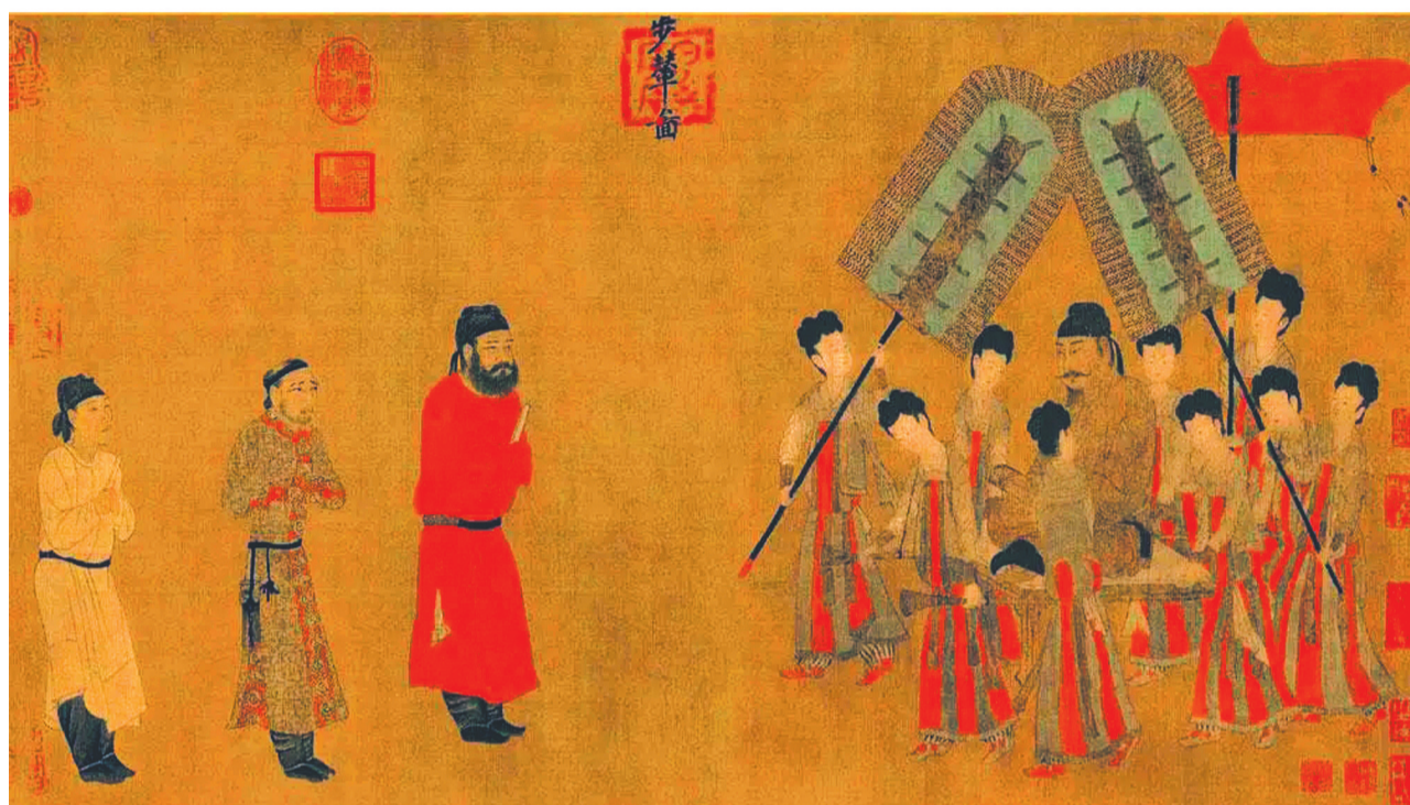
辽博展出的《步辇图》(局部)