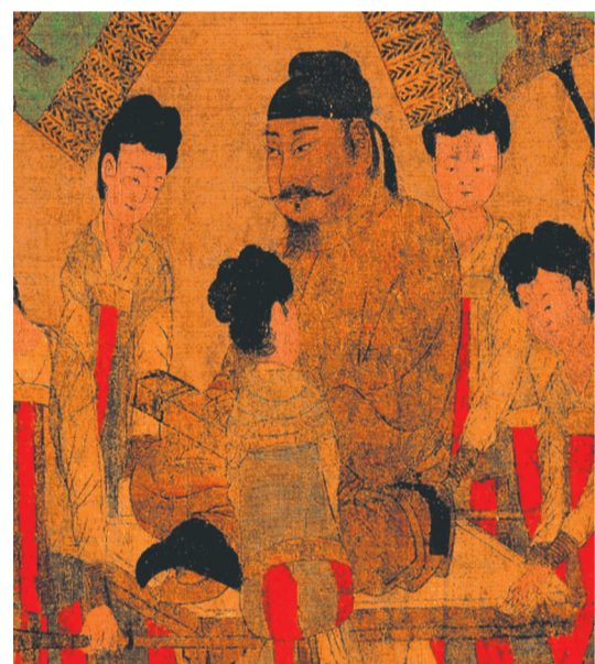
唐太宗的表情很丰满