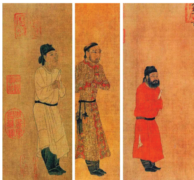
唐太宗面前的三个人,服装层次分明