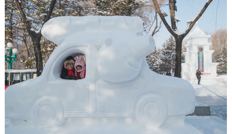
12月23日，游客在哈尔滨太阳岛雪博会园区内与雪雕合影。当日，以“冰雪共融 欢乐同行”为主题的第32届哈尔滨太阳岛国际雪雕艺术博览会正式开园迎客。