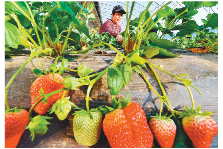
12月23日，滦州市东安各庄镇东孟家屯村农民在大棚内管理草莓。双节临近，河北省滦州市东安各庄镇的农民抓紧时间进行果蔬培育、管理、采摘等工作，以保障市场供应。