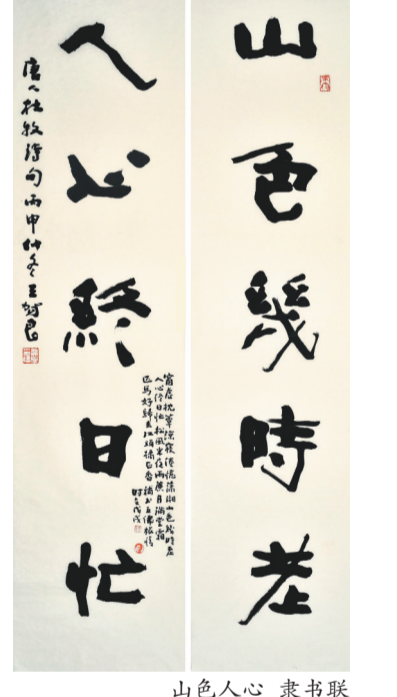
山色幾時老 隶书联