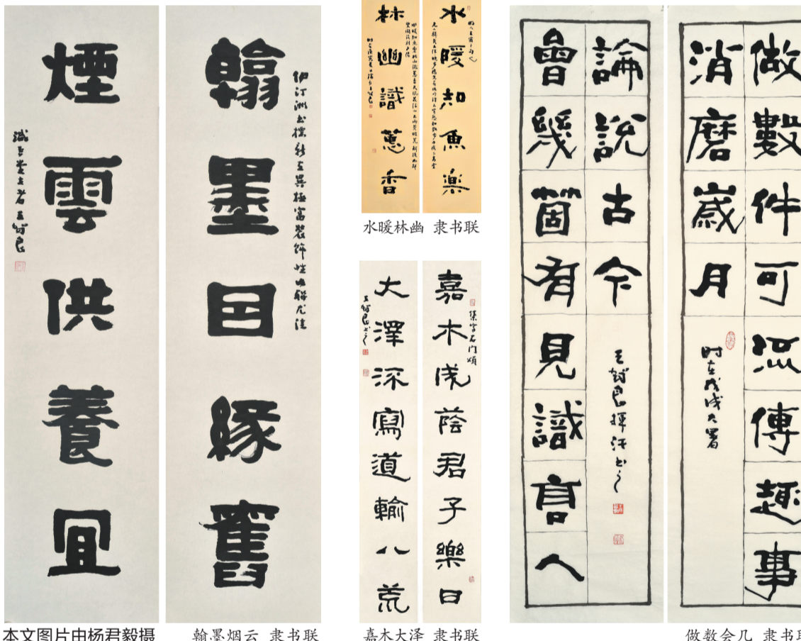
煙雲供養且 隶书联