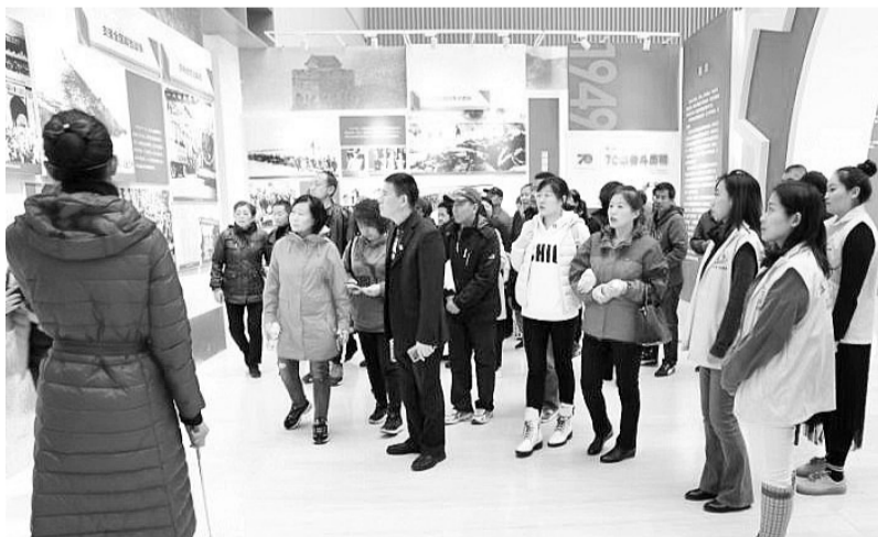
志愿者为读者作展览讲解。