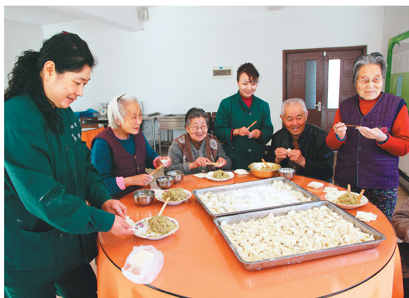
逐步完善的养老服务让抚顺金岭养老院的老人安享晚年。

根据2016年抚顺市民政局和财政局联合下发的《关于发放民办养老机构运营补贴的通知》精神,给予民办养老机构运营补贴支持。补贴标准为