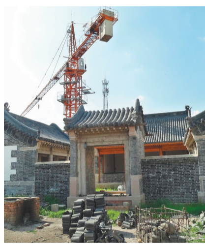
建设中的尹湛纳希故居。