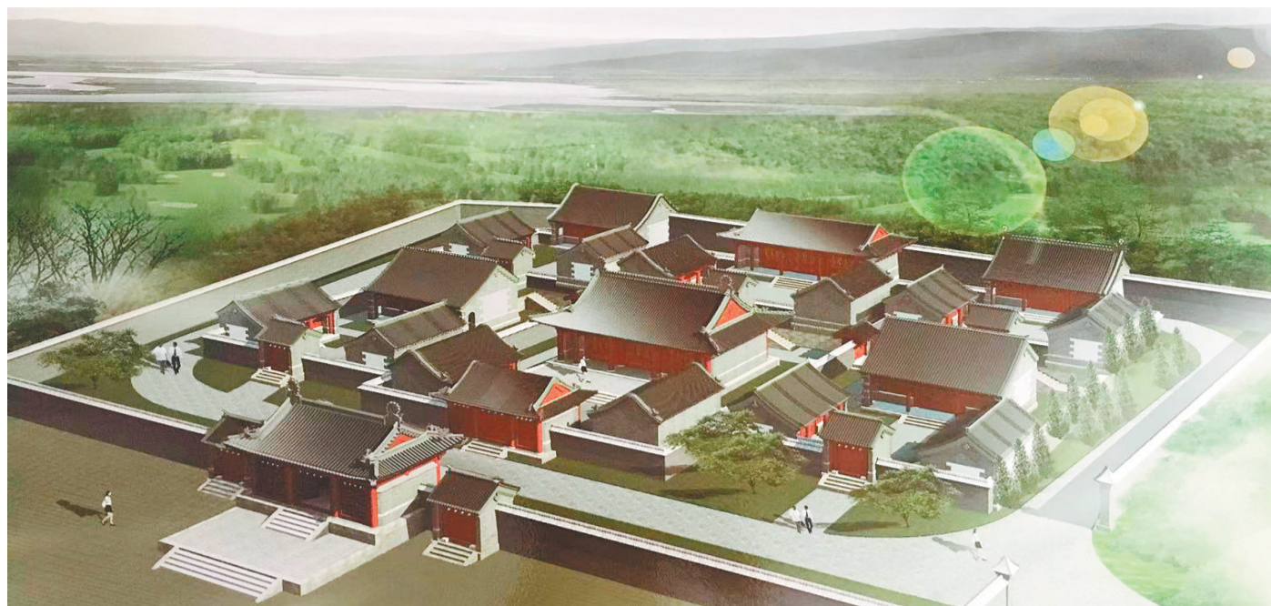
尹湛纳希故居效果图。(资料片)

核心提示 北票市下府经济开发区三府村，是成吉思汗第28代孙、清末蒙古族著名文学家尹湛纳希的故乡。如今在村庄的青山绿水边，一座建筑面积1500平方米的尹湛纳希故居——“忠信府”，正在紧张复建中，预计今年年底竣工，明年对外开放。 作为蒙古族现实主义小说鼻祖，尹湛纳希创作了《青史演义》《一层楼》《泣红亭》《红云泪》等文学作品，被誉为蒙古族“曹雪芹”。这些文学成果不仅属于蒙古族，也是中华民族文学宝库中的瑰宝。复建尹湛纳希故居，挖掘和整理尹湛纳希的文学遗产，意在打造尹湛纳希历史文化品牌，更好地继承、弘扬传统文化，并借助尹湛纳希在中国、蒙古两国间的较高知名度，增进中蒙间文化交流和经贸合作，加快辽宁融入“一带一路”中蒙俄经济走廊步伐。