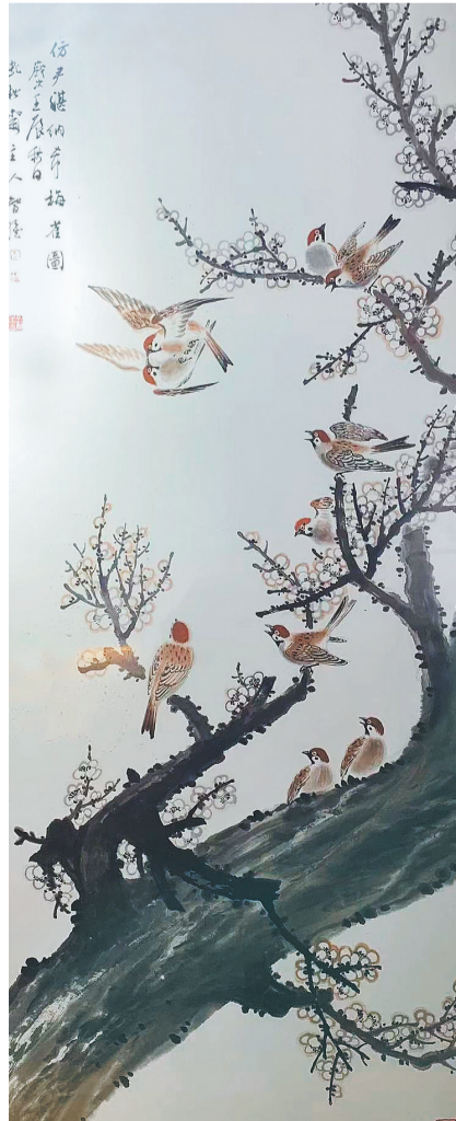
尹湛纳希创作的《梅雀图》(摹本)(资料片)