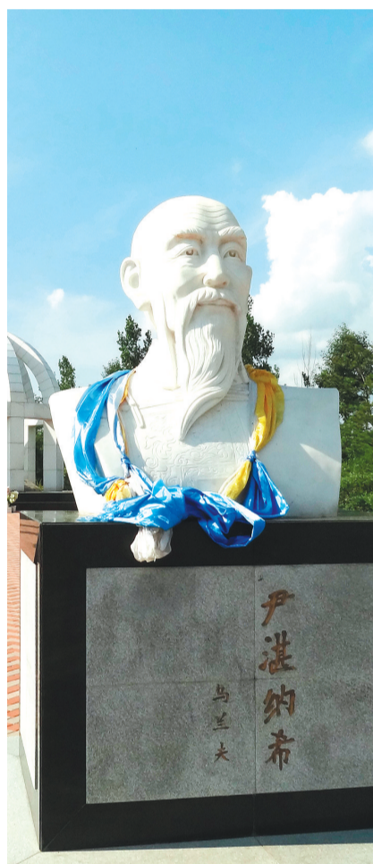
三府村尹湛纳希像。

在100多年后的今天，复建尹湛纳希故居，挖掘和整理尹湛纳希的文学遗产，可以让更多的人了解尹湛纳希的文学作品和历史地位，对于继承、弘扬中华民族传统文化具有重要意义。