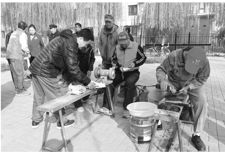
党员志愿者为居民提供各种便民服。